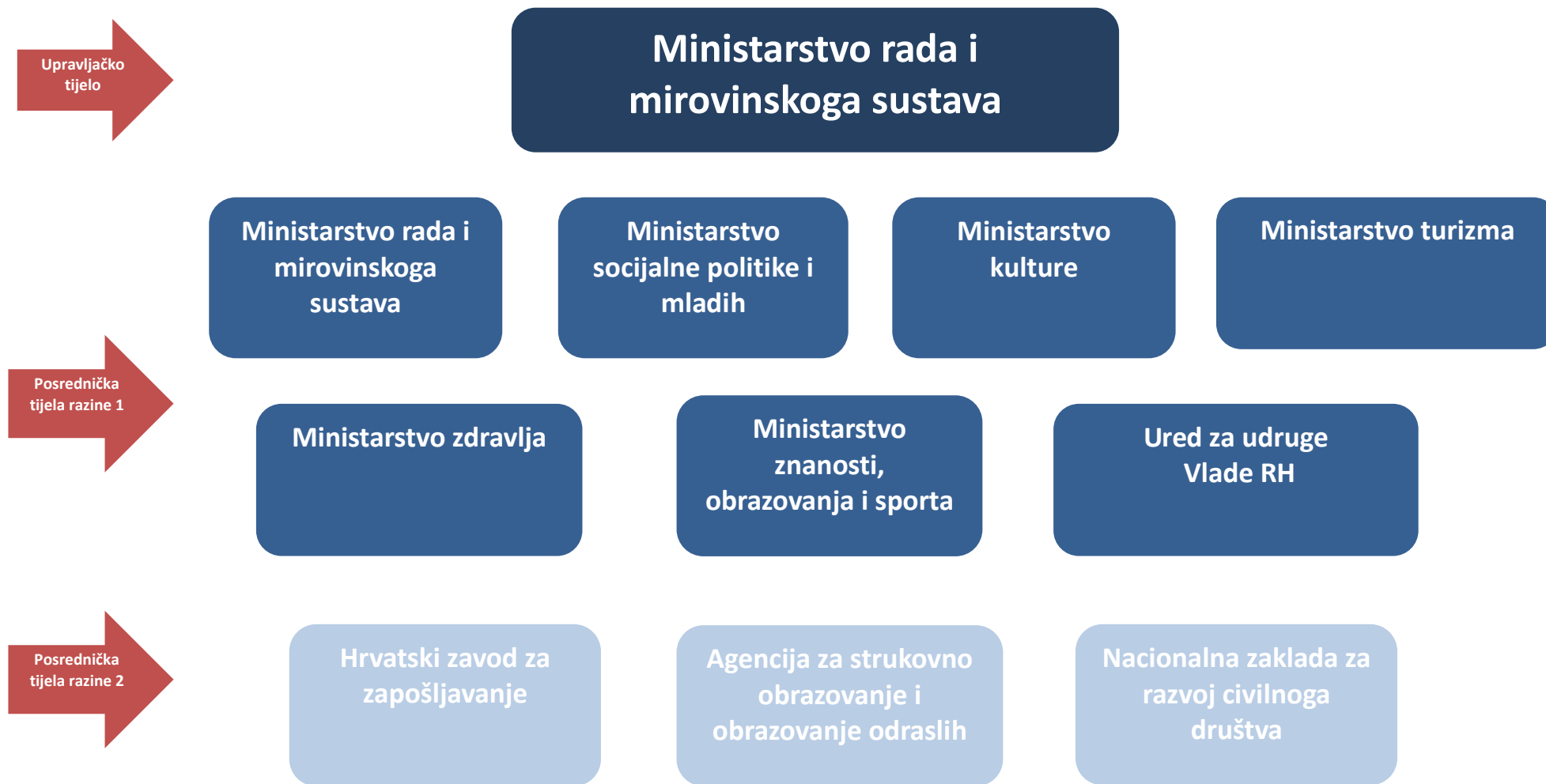
Slika 1. Shematski prikaz Sustava upravljanja i kontrole korištenja ESF-a za razdoblje 2014. – 2020.